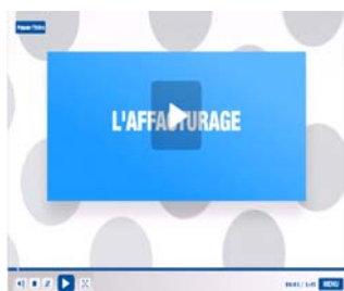
Vidéo sur l'affacturage

Pour découvrir le nouveau site, rendez-vous sur www.professionnels.societegenerale.fr , ou cliquez sur les images