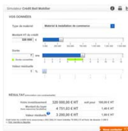
Simulateur credit- bail