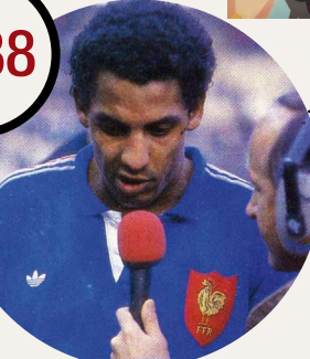
© M. Francotte / FFR-Société Générale Serge Blanco