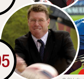
Nick Farr-Jones

Partenariat entre Société Générale et la Ligue Nationale de Rugby (LNR).