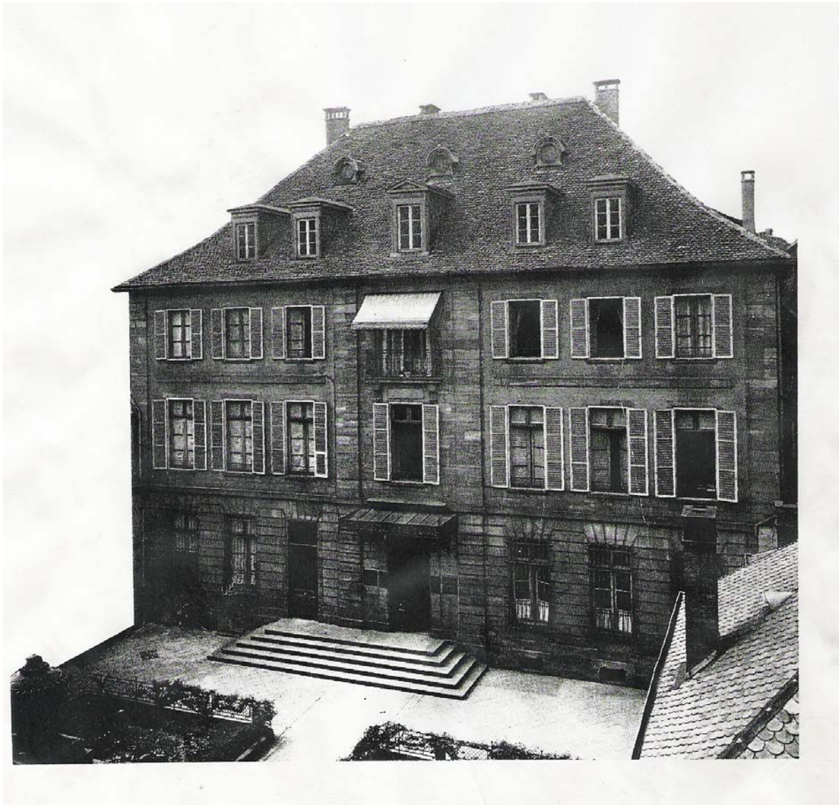
Hôtel Livio, siège de la Sogénal à Strasbourg ( La Sogénal, Livre du Centenaire, 1881-1981 , Strasbourg, Sogénal, 1981)

L'Hôtel Livio est occupé depuis 1870 par la succursale de Strasbourg de la Société Générale, puis de la Sogénal dès 1881. Il a hébergé la Présidence la Direction Générale de la Sogénal jusqu'à son absorption en 2001.