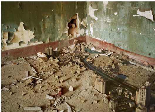
Unregistered City NO.2