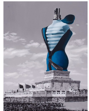
I Feel that You are Leaning on My Shoulders