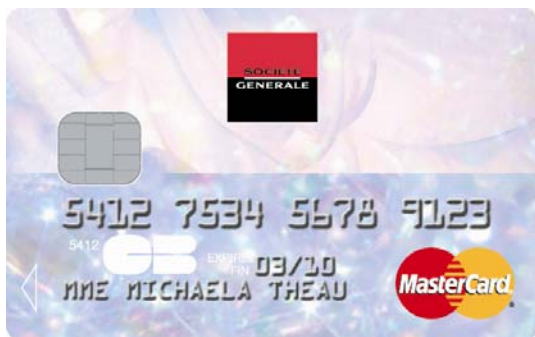
cristal – une carte tout en reflets et brillance.