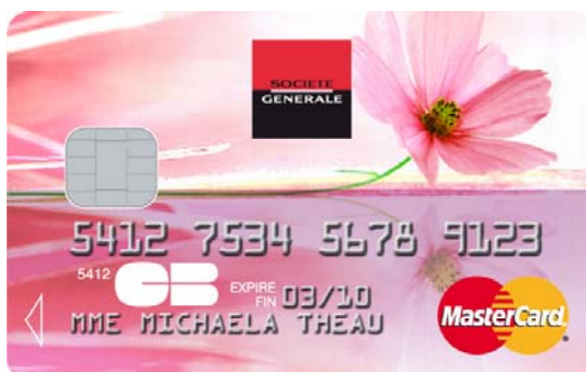
naturelle – une carte au toucher doux, pour exprimer son côté nature