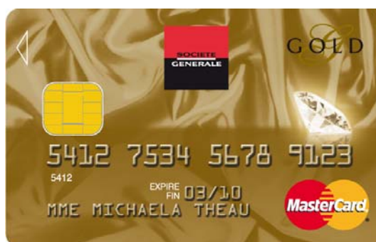
diamant – son éclat est mis en valeur par un procédé de fabrication inédit