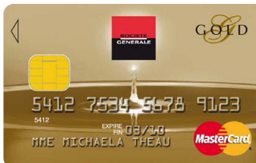
goutte d'eau – une onde de charme intemporelle