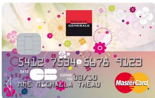
acidulée – une combinaison mate et brillante de couleurs vives